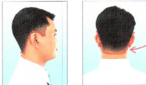
ทรงผมทูปถ็อค

นักเรียน นักศึกษา ชาย ไว้ผมยาวด้านหลังและด้านข้างต้องไม่เกินตีนผม