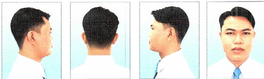
ทรงผมอันเดอร์คัต