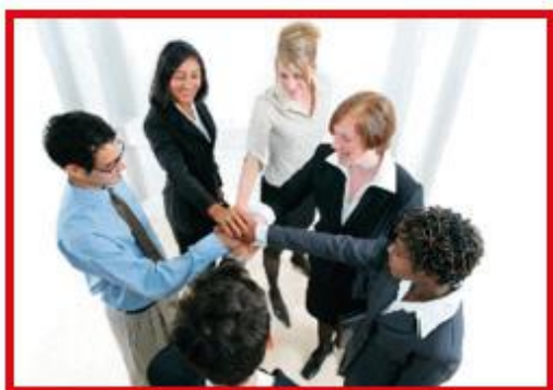
การทำงานด้วยความร่วมมือ