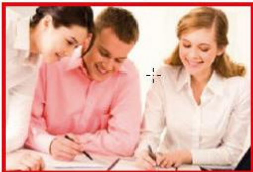
การทำงานด้วยความร่วมมือ

คำสั่ง : ให้นักเรียนอธิบายได้รูปภาพที่กำหนดให้ว่าเป็นการขาดจริยธรรมหรือเป็นผลจากการมีจริยธรรมอย่างไร