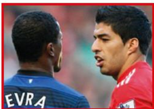
การทำงานด้วยความร่วมมือ